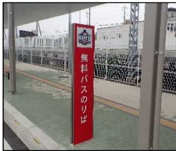
③ポトレス桐生バス停