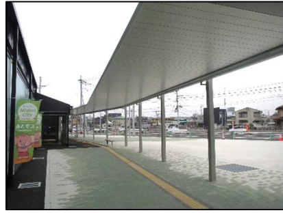
⑨デジタルサイネージ