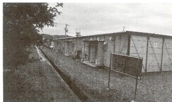
気仙沼中学校校庭の仮設住宅