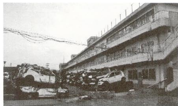
気仙沼南小学校今はガレキ置き場