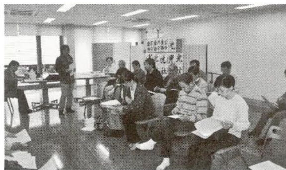
気仙沼歯科医師会震災後の初会合