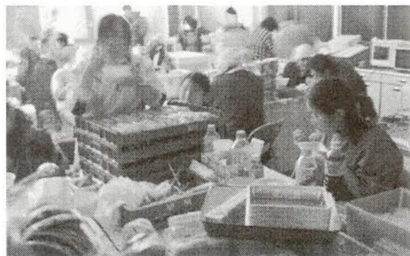
家庭科室での食事