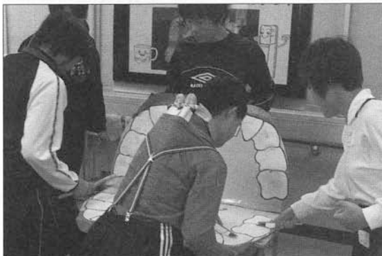
写真4 模型を使って歯垢を取り除く練習

給食後の歯みがきでは、まず自分で歯をみがいた後、担任のところへ歯ブラシを持っていき、仕上げみがきをお願いする児童の姿が見られるようになってきている。