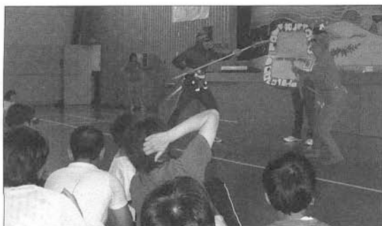
写真3 寸劇を行っている様子