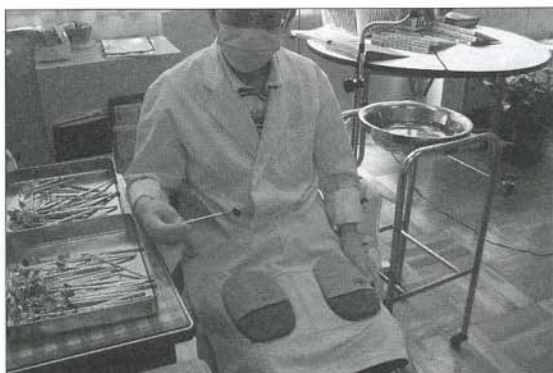
写真1 手はおひざシート

給食後、歯みがき指導を全校で実施している。自宅から歯ブラシとコップを持参し、給食が終わった学級・学年から洗面所、あるいは教室で歯みがきを行う。小学部のころには、口を開けること