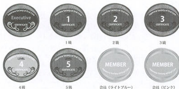
日本口腔ケア学会 認定バッジ *実寸は25mm

価格は一個2,000円となっております。学術大会などで販売を行っております。学術大会の本部事務局ブースでは対面販売を行います。大会御参加の際にはお立ち寄りくださり、一度、手に取ってご覧ください。