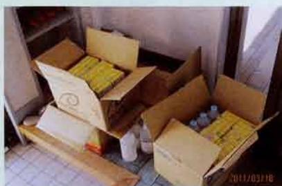
口腔ケアの物資が到着。

避難所では、義歯を紛失して困っているおじいさん、子どものう蝕に悩むお母さん、充填物や冠が外れてしまった人など、被災者はさまざまな問題を抱えています。しかしようやく通電したのは3月21日で、しかも診療可能となった歯科医院はたったの2軒でした。せいっぱい自分ができることに取り組んではいましたが、無力な気持ちでした。