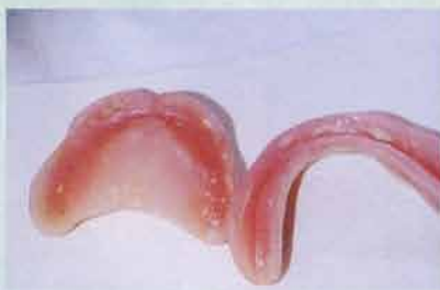
デンチャーブラークが付着した義歯。