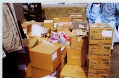
全国から届いた救援物資。