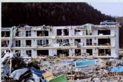
気仙沼市街のようす。

初めて見た光景は、黒く焦げ臭い焼け野原となり、瓦礫と化した町の姿です。川にはいろいろなものがひしめきあい、道路はヘドロで滑りやすく、電線や危険なものがたくさん