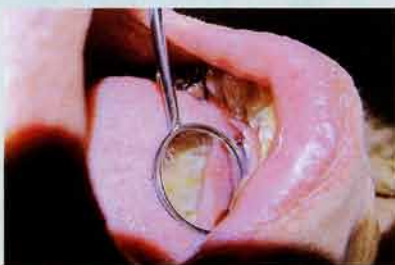
介護施設での被災者の口腔内。