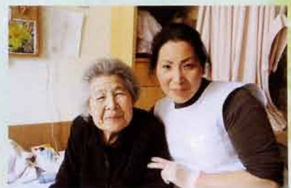
介護施設にて被災者と筆者。ようやく笑顔が戻った。