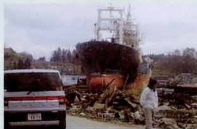
市街にまで船が流されている。