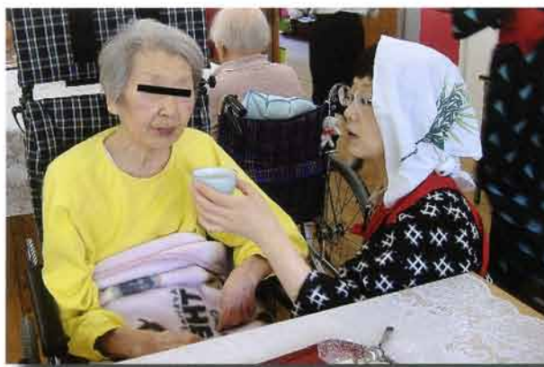
亀爪園の新茶を楽しむ会。茶娘に扮して新茶を楽しんでもらう。

歯科衛生士として頼れる先輩や大人に出会って親しくなるのも大切ということも、学生に伝えたいという。