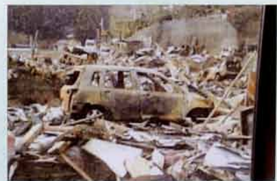
変わり果てた姿の自動車。