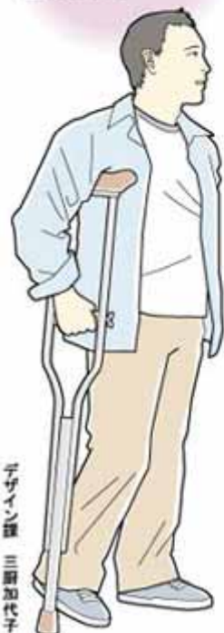
デザイン 三浦加代子