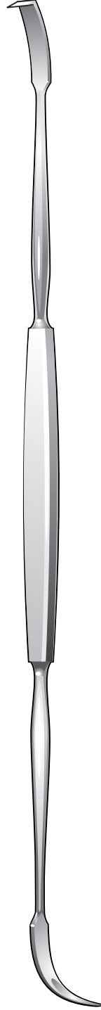
●小野氏上顎洞粘膜剥離子 (兼起子)