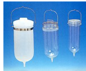
2000cc 1000cc 500cc