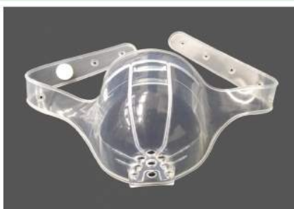
シャワープロテクター

～日々の生活を快適にするケア用品（別売り）～ * 商品の仕様は都合により変更する場合がございます。