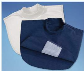
Tシャツタイプエプロン