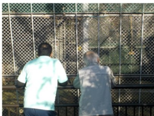
時にはたそがれてみたり