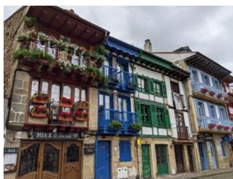
カラフルな家々が並ぶ漁師町オンダリビア