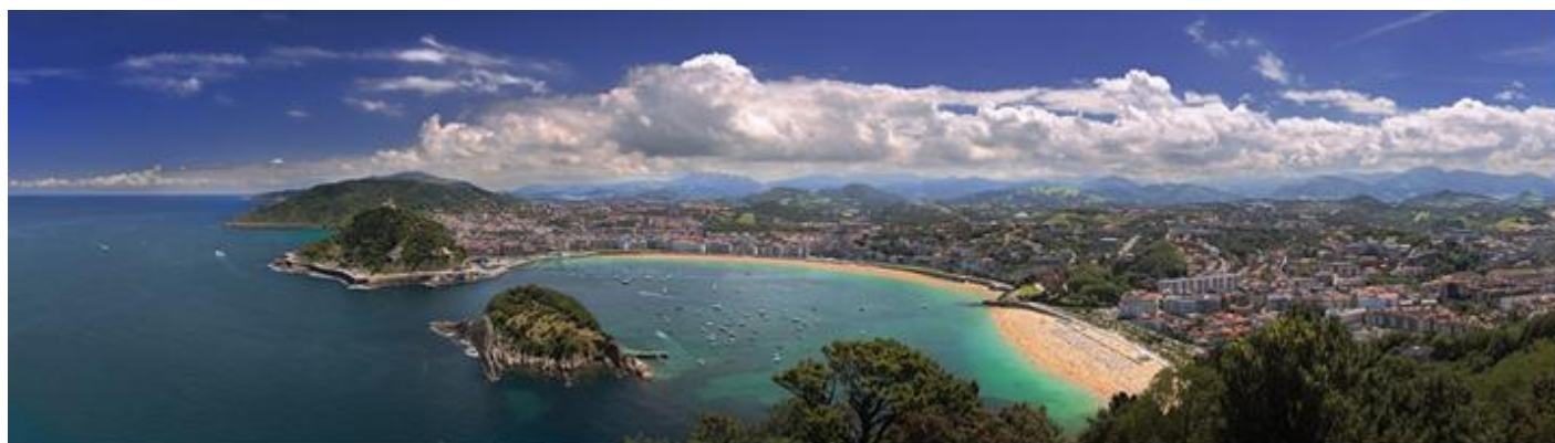
サン・セバスチャン市街地とラ・コンチャ湾

★帰国後、講評会【11/23(月・祝)15時～】写真展は2027年2月に開催予定。(別途会費)