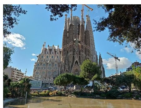
サグラダ・ファミリア(バルセロナ)