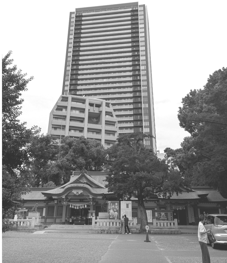
金神社 (岐阜県・岐阜市)