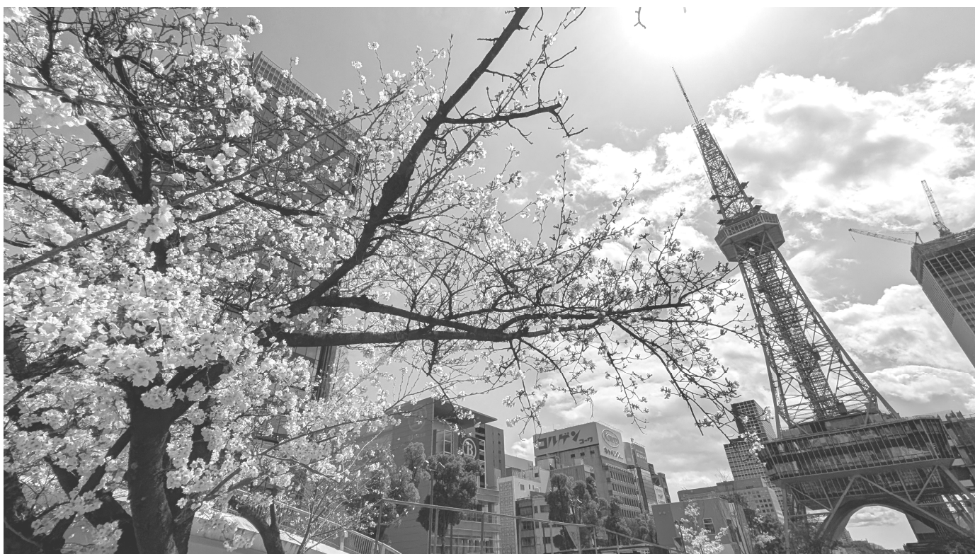
TV 塔と桜 (名古屋市・中区)