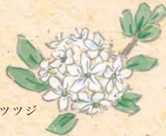
カラフトイソツツジ