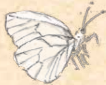
エゾスジグロチョウ