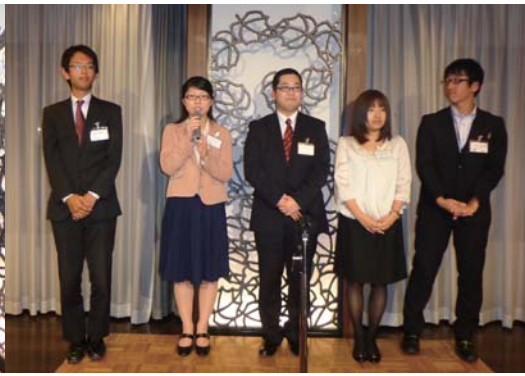
H25 ニューフェース 揃い踏み