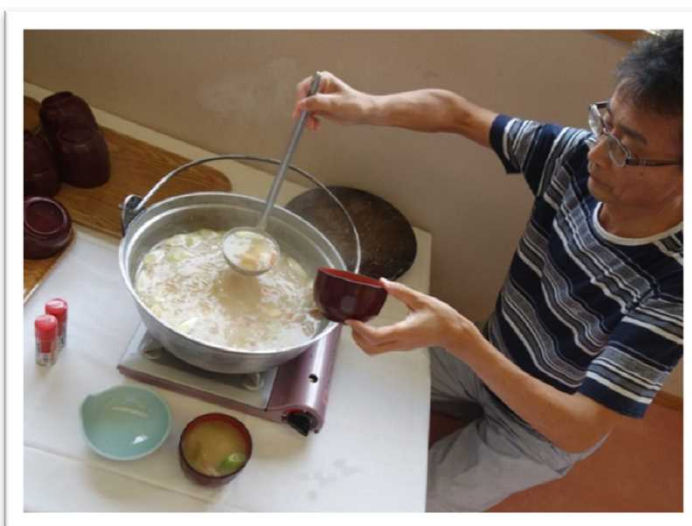
参加者の好みは、山形芋煮の圧勝でした。