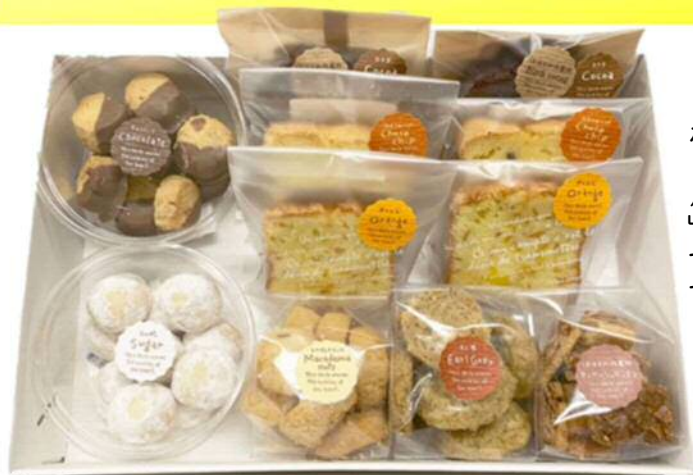
▲人気のマカダミアクッキーとスノーボールも入った詰め合わせ