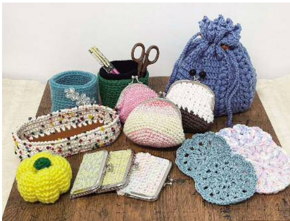
▲ニット製品や、がま口などの小物いろいろ

一人はニット毛糸編み、ある一人はコンピューターなどの機械系、またある一人はかぎ編みといった自分自身が見つけ出した得意分野や『やってみたらこんなことが得意』、『やってみたら出来た』という新しい発見ができる場所としてこれからも多様性（事業所の名前にもあるように）色々なカラーの人たちの集まれる場所にしていきたいと毎日一所懸命に取り組んでいます。