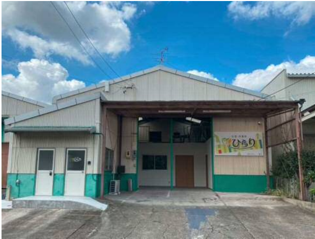
▲2021年9月に新しくオープンした「作業所ひらり」。「みら来る」「くるり」のすぐ近くにあります。