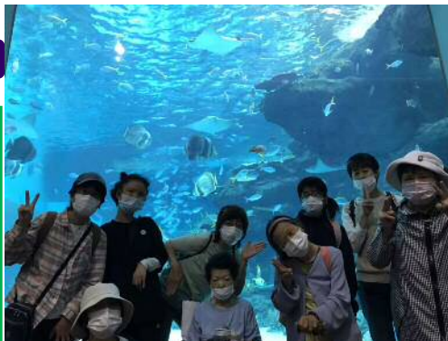
▲いろいろな活動も行っています

余暇活動にも、大切さを感じ、絵画クラブやオセロクラブ・音楽サークルなどがあります。作業所内で、球技大会を行ったり、社会見学もあります。作業以外にも楽しいことがいっぱいあります。