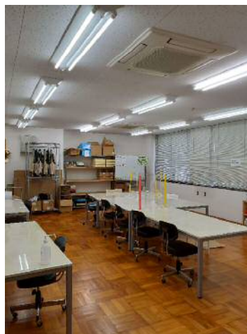
▲作業室の様子です

のぞみではメール便以外にも内職作業やクリーニング作業、清掃作業といった作業も行ってまいります。見学は随時受け付けておりますので、興味のある方は一度ご連絡下さい。お待ちしております。