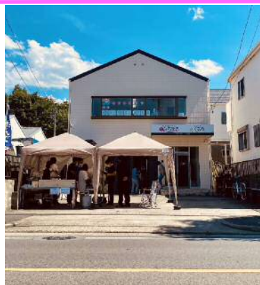
▲2021年9月に移転オープンした「みら来る」と、同じ建物に新しくオープンした「くるり」。