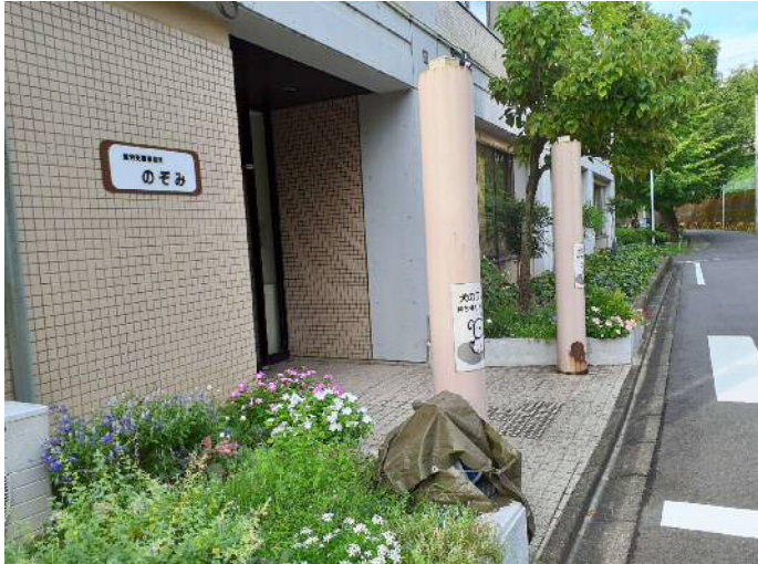
▲事業所の外観です