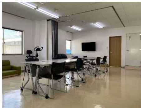
▲新しい建物で、広くて明るい「くるり」。明るいスタッフがあなたをサポートします。

そんなT君も今では、持ち前の明るさと優しさで作業所のムードメーカーになり、作業内容をみんなに伝えることができる頼もしい存在へと成長しました。 得意分野「検品」 口癖「検品の鬼！」 「人に厳しく自分に甘く」