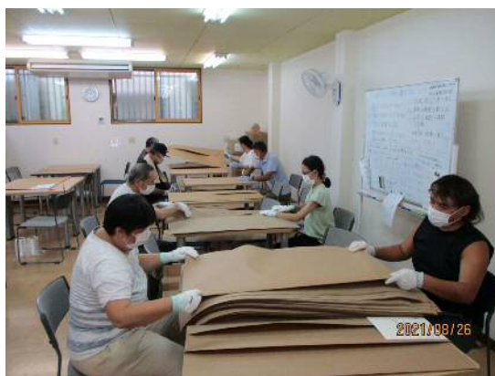
▲大きな紙を二人で折っています

その他、バッグやグッズの検品や袋詰めも行っています。萌作業所では、できる仕事を楽しく行っています。