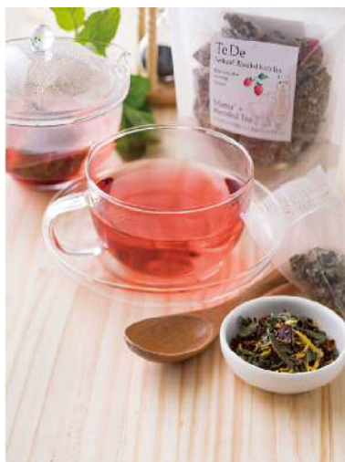
■守山区のイベントでは特別価格でご提供することもあります