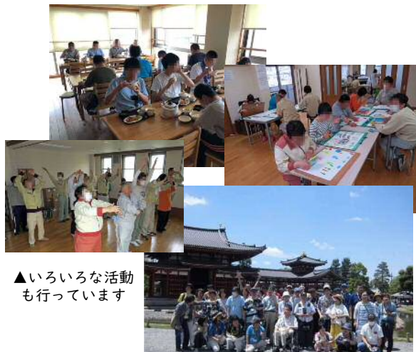
▲いろいろな活動も行っています

昼食も楽しいひととき、手作りの給食はみなさんに大人気！食後は、散歩やフットベースボールなどで身体を動かしています。