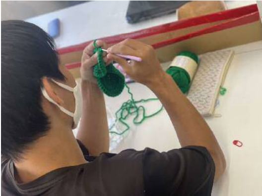
▲ニット毛糸編みに取り組む利用者さん！

一人ひとりが別々のことで特技を見つけて出し、強みを見つけ、作品や商品のクオリティを上げていくという目標を掲げています。全員が同じことができるというのではなく、一人ひとりでできることや、やれることを今よりも伸ばし、完成度を上げて得意を生かすこと、可能性を見つけて出すことに力を入れた作業所です。