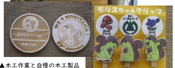
▲木工作业と自慢の木工製品