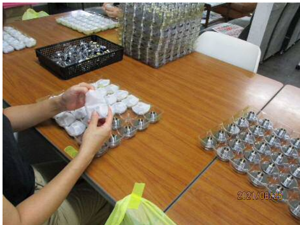
▲できる作業を細かく分けて、それぞれがコツコツと行っています