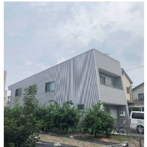
▲作業所のどかの外観です

色とりどりのガラススタイルを、コルクコースターの上にとつひとつ並べてデザインを決め、最後に丁寧に接着していきます。どのメンバーであっても手早く作れるように、基本デザインを決めてあります。作っても売れなければ工賃になりませんから、基本デザインはとても重要です。売れ行きがよかったデザインが分かるように写真に残しておいたり、いろいろなデザインを作ってみて、「どれならお客さんに気に入ってもらえるだろう」と、メンバーも職員もみんなで頭を悩ませたりしています。みんなの知恵とセンスの結晶です。たくさん売れた時には、喜びもひとしおです！