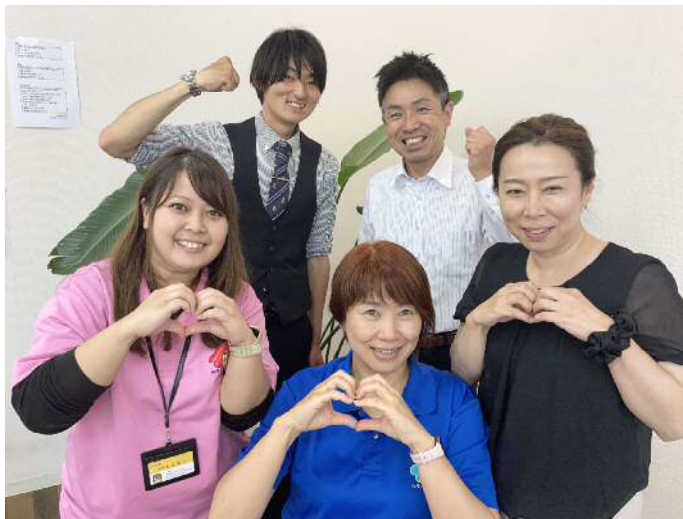
▲笑顔の支援員があなたの「笑顔で働き続ける」をサポートします

ルクスキャリアセンターでは、事 業所を通して就職した方を卒業生と 呼びます。 卒業生が集まる懇親会を三ヶ月に 一度開催しています。 懇親会の際に「ルクスを通しての 就職はどうですか？」という質問を してみました。