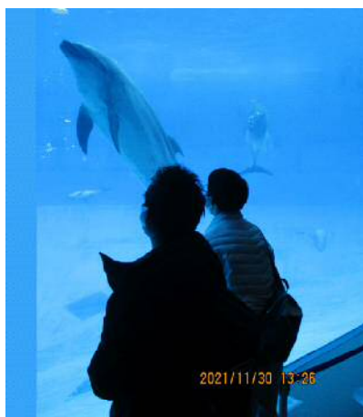
▲レクでお出掛けすることもあります。

作業を一時間行って、一〇分休憩があり、ほとんどが座り仕事です。初めての人も無理なく始めていけることをモットーに、常にいくつか選べるように作業を用意しています。作業もいくつかのパートに分けているので、自分のできることを選びます。