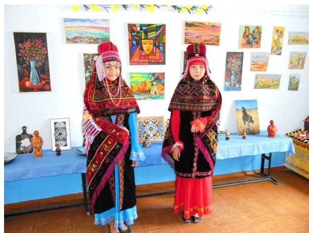
カラクルパクの民族衣装を着た女子