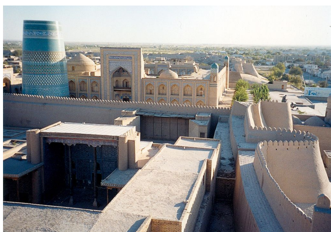
イチャン・カラ(ヒヴァ)世界遺産