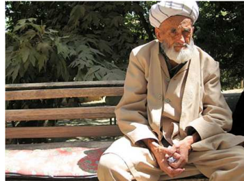
ウズベキスタンの老人