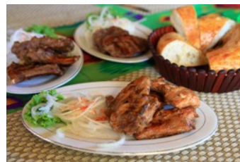
主食はナンとお肉

シルクロードの要衝に栄えたことから、中華風、ロシア風、アラビア風といった東西の味が楽しめます。主食はナン(パン)とお肉、スープやサラダといった前菜、メイン料理には日本人の口にも合った料理が並びます。また水餃子や蒸し饅頭のようなものも出てきます。