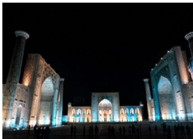
レギスタン広場のライトアップ(イメージ)