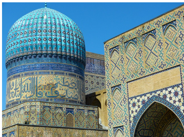
レギスタン広場(サマルカンド・世界遺産)

★帰国後、講評会【6/20(木)14時～】、写真展(7/3～7/31)を開催します。(別途会費)