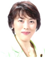
参院議員 党副委員長 田村 智子