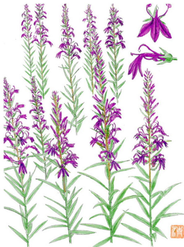
サワギキョウ 沢桔梗 2020.08.09 (キキョウ科ミゾカクシ属) 長野県入笠山

のスキーのかわりとしてマウンテン・バイクの客やハイカーでにぎわっています。湿原にはアヤメ・クリンソウ・エゾリンドウ・クサレダマ・アケボノソウ・レン