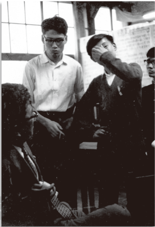
▲都立戸山高校時代。当時は左翼少年だった。この写真は「自主授業をさせる」と学校に申し入れているところ