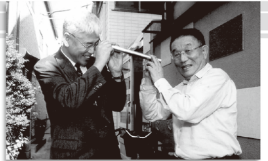
▼平成6年に埼玉大学教授となり、9年から 政策研究大学院大学教授を務めた。毎年、 大晦日には学生を自宅に招き、一緒に初詣 をすることにしていた