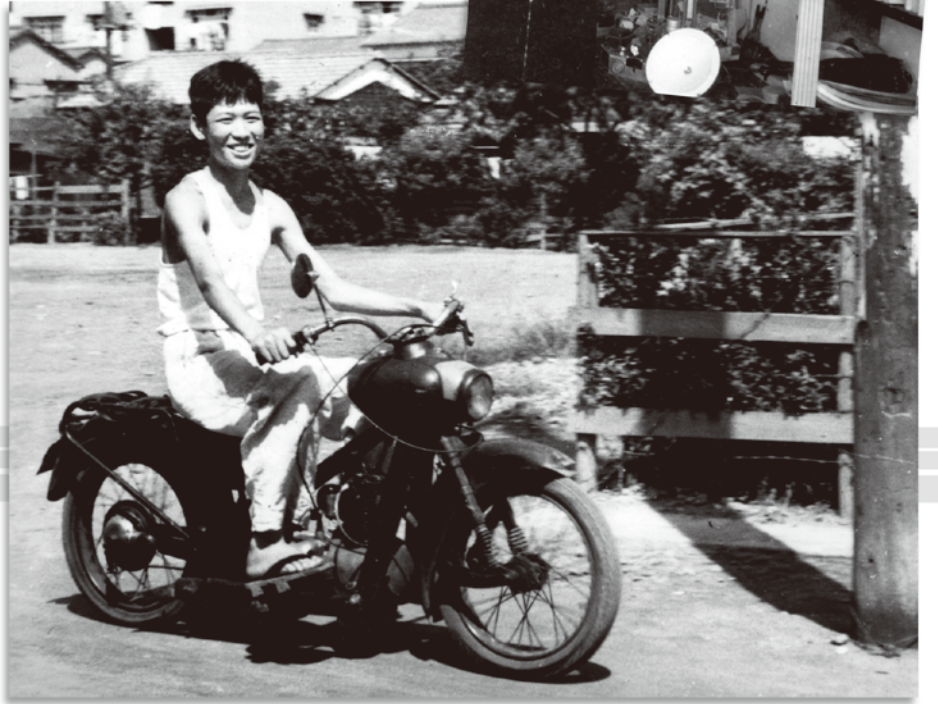
▼昭和34年5月、14歳になってすぐにバイクの免許を取った。ペビーライラック号を買って、エンジンをバラしては組み立てることを繰り返した。これ以降、私の足は単車となった