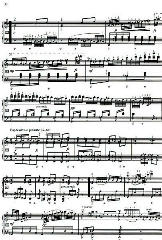
浄書見本 左=《ロマンスと変奏》右=《即興曲「ウィーンの思い出」》

当版によりクララ・シューマンの作品が多くの人たちに演奏され、理解されることを願ってやまない。