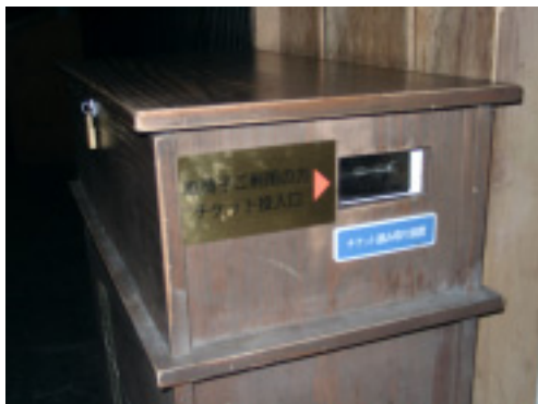
この機械に入場券を入れます。

A . 4 車椅子専用のエレベーターがあります。入場するときに、入場券に加工をしてもらい、その入場券を使ってエレベーターへのドアを開けます。エレベーターの前に入場券を入れる機械があり、その機械に入場券を入れるとドアの鍵が開くという仕掛けになっています。なお、その鍵は入口で加工してもらった入場券でしか開かないので、他のお客さんはエレベーターを使えないのです。そのような方式をやっているところは知らないなので、ちょっと面白かったです。