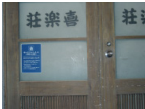
ココが 2 階のエレベーターの入口です。