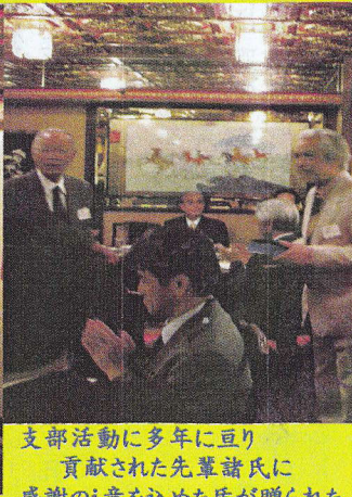
支部活動に多年に亘り 貢献された先輩諸氏に 感謝の意を込めた盾が贈られた