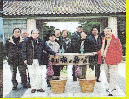
ゴルフ大会 遠くから駆けつけて大会に大活躍された各支部の方々、親睦の輪が広がりました