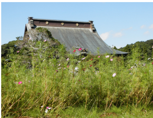
長福寿寺 写真上はコスモス（9月）、 右が紅花（6月）。秋の新しい名所になるかな？