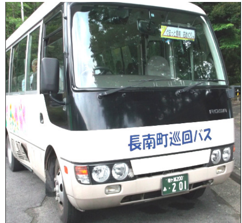
花めぐり巡回バス

長南町役場から長福寿寺の紅花、野見金公園のアジサイの花めぐりとして、マイクロバスが何台も巡回して、見学者には嬉しいサービスだ。