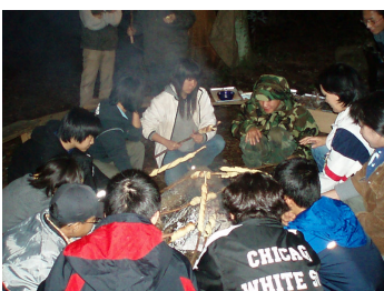
ツイストパンを焼きました