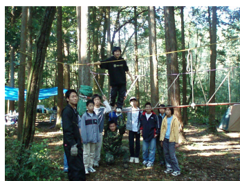
モンキーブリッジの前で

隊行事でキャンプが続きましたが、班のまとまり、隊訓練にはキャンプが一番効果的な方法と考えます。