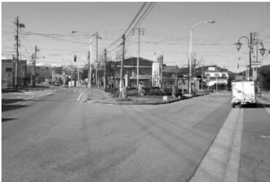
現在の大黒町の画像

また、大黒町の北端、追分のあたりでは、右に曲がれば美麻を抜けて善光寺へと続く道。左に曲がれば四か庄、小谷から越後へと続く道に分かれています。道にはいまでも、延享元年に建てられた道標があります。。