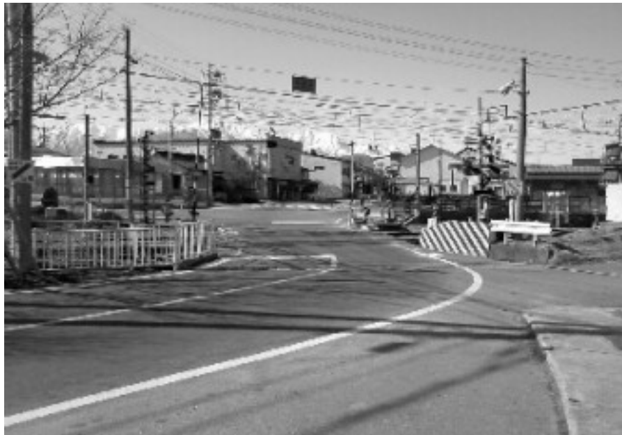
現在の五日町の画像。どの辺りに木戸があったんでしょうかね？