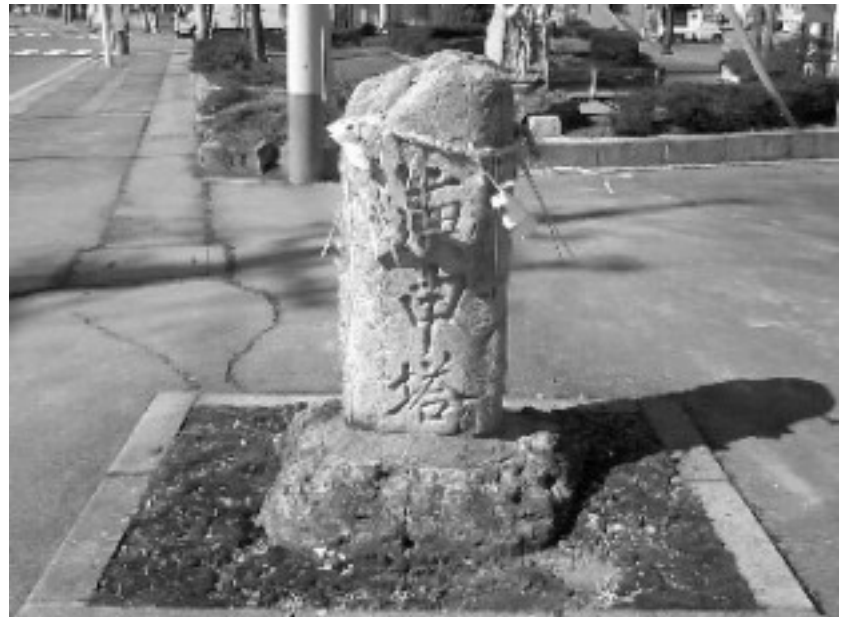
延享元年に建てられた道標