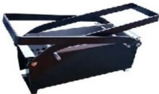
薪薪づくり器 紙与作

薪ストーブの設置も時間さえあれば、業者に頼まなくても自分でできるようで、設置するスペースにブロックなどを置きその上にストーブ、室内と屋外に煙突を引き回しさえすれば終了(時間的には半日あればできるようです)。ホームセンターには煙突関係がL型やT型、スチール製やステンレス製など各種そろっていて、一般的な距離や高さで約2万円~3万円ほどで出来上がるようです。また、肝心の薪を今から準備するにはきついかと思われそうですが、ホームセンターなどでも一束500円程度で購入することができます。お休みの日は薪ストーブで過ごすのもいいのではないのでしょうか？！