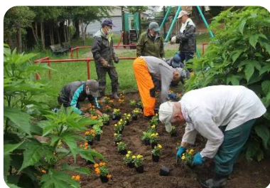
みんなで頑張りました。「幸清水公園」

新型コロナウイルス感染症の影響で、多くの町内会で花植えが中止になる中、6月28日秋葉1丁目ではみなさんに元気を届けることができればとコロナ対策を講じ、今年度も町内から参加して頂いた方々で、さくら並木、せせらぎ遊歩道沿い、幸清水にマリゴールド、サルビア、ポーチセラカなど約800株の花植えを行いました。道路沿いや幸清水に植えられた花々は見事に咲き誇り、通りを行き交う多くの人達が楽しんでくれたと思います。