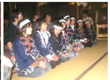
(写真左：雨の中の子供みこし 右：拝殿で神事に臨む子供たち)