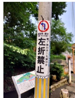
対左折進入用電柱設置型看板