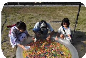
ボールすくい楽しいね