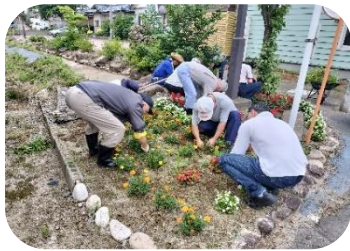
せせらぎ通り 中沢寄り