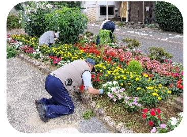
せせらぎ通りガード近く