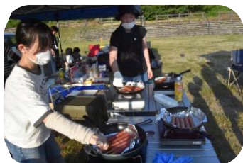
フランクフルト美味しそう

会場では各町内会をはじめ、PTA、青年会、寿楽会、うらら会、の全8ブースで、焼きそば、フランクフルト、こんにゃくの食べ物や生ビール、ジュース、ラムネなど飲み物の販売が行われ、またお祭りには欠かせないゲームとして射的、バルーンアート、お魚釣り、スーパーボールすくい、型抜き、モルック、輪投げ、迷路、プラレールなど楽しいブースもあり、子供から大人まで食べて飲んで今年の夏を大いに楽しんだ納涼夏まつりでした。