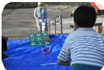
簡単だけど意外に難しい輪投げ