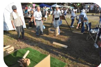
寿楽会モルック ストライク連発!!

秋葉町内実行委員会では今年も各ブースで使える割引券(200円分)を予め配布しました。当日は多くの方から利用いただき大変好評でした。