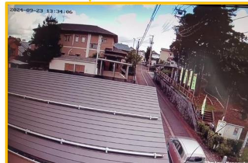
カメラ② 乙女坂方向