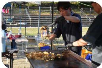
焼きそば焼くのはめっちゃ暑い!