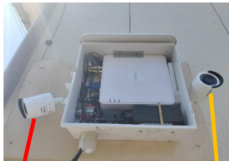
【カメラケース内状況】