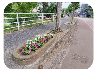
花も見応えよくなりました