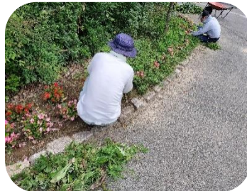
せせらぎ通り 山先寄り