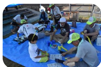
ここをこうやってね・・・バルーンアート