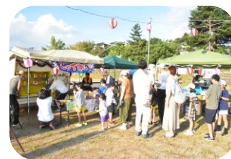
今年も1丁目の射的は大人気