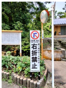
対右折進入用立て看板