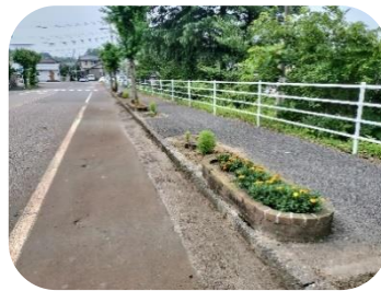
きれいになった桂並木花壇