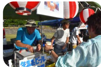
どんどん売れます青年会の生ビール