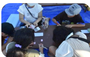
初めて型抜きやってみた