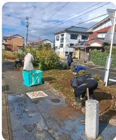
せせらぎ遊歩道の花壇清掃

町内の皆様におかれましても、町内会活動等に積極的に参加いただく等、皆で一緒になってより良い町内となるようご協力をお願いいたします。