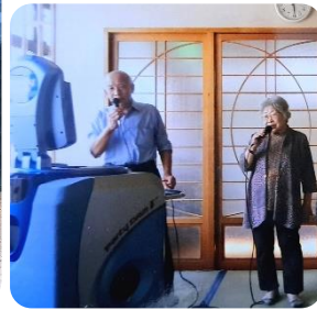
カラオケも楽しみました