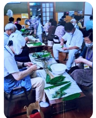
大勢の方が参加した伝承のちまき作りの様子